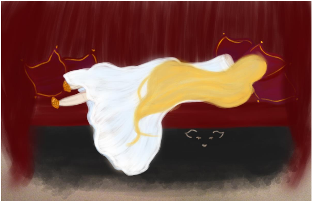
Donat vit la Fée sommeillant sur un beau lit de velours ponceau...

Quant Donat la crut endormie, il s'approcha sur la pointe des pieds de la porte entr'ouverte, la poussa très légèrement et vit la Fée sommeillant sur un beau lit de velours ponceau. Sa longue robe était un peu relevée, et il remarqua, à sa grande surprise, qu'elle avait le pied sans talon, précisément comme une patte d'oie... Il se retirait tout doucement, lorsqu'une des levrettes cachées sous le lit de sa maîtresse se mit à japper. La Fée se réveille, voit Donat et lui crie : « Arrête, malheureux ! J'étais contente de toi jusqu'à ce moment ; à la fin de ce premier mois d'épreuve, j'avais le dessein de te prendre pour mon époux, et de partager avec toi ma puissance, mes secrets et mes richesses. Pars incessamment ; retourne à la suie de ta forge ; comme je ne reprends pas ce que j'ai donné, emporte tes deux bourses ; oublie tout ce que tu as vu et entendu dans ma grotte, et si jamais tu le révéles à qui que ce soit, ton châtement suivra de près ! »